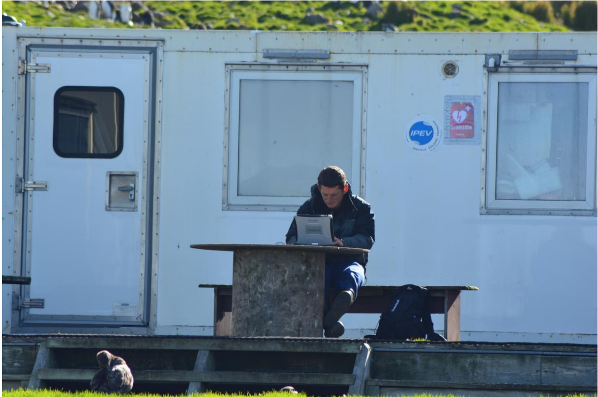
Le 5 mars, en Baie du Marin, en train d'écrire ce numéro du journal Argonautica !