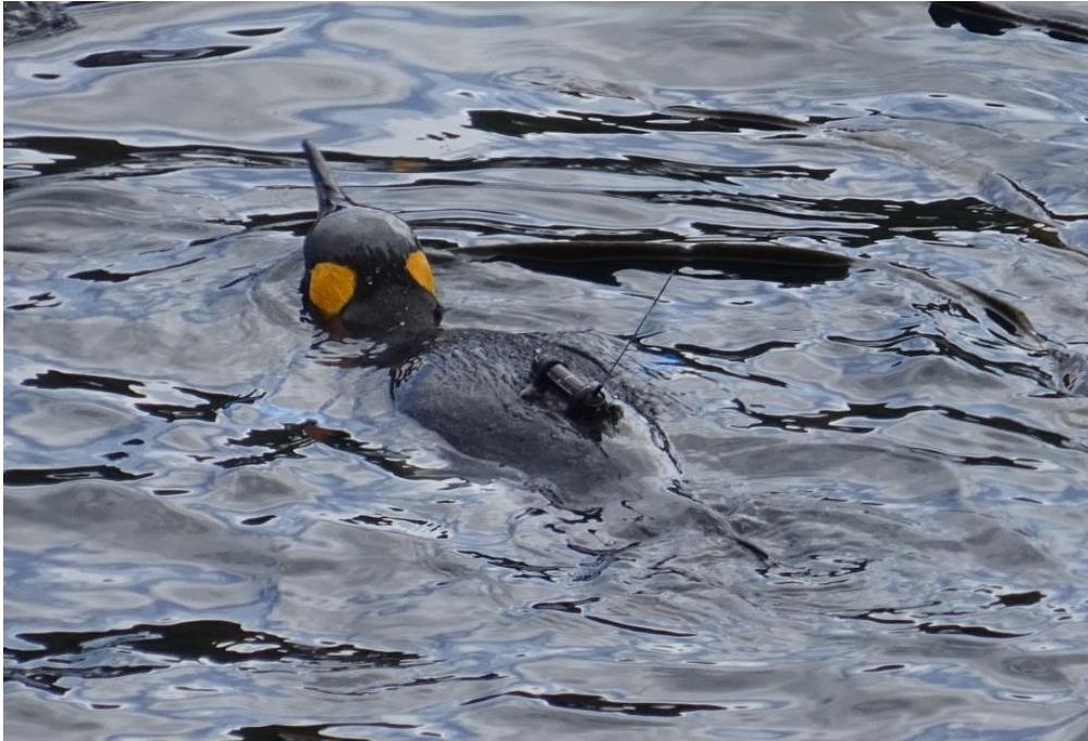
Figure 1. F14, équipé de sa balise Argos (166438), part en mer !

- F04 (le conjoint de F14) qui quant à lui portait la balise 166437 , est revenu le 24 février, après 15 jours en mer. J'en ai profité pour retirer sa balise (figure 2), et la reposer le lendemain sur l'individu V00, lequel est parti en mer le 26 février (pas facile à suivre tous ces mouvements !)