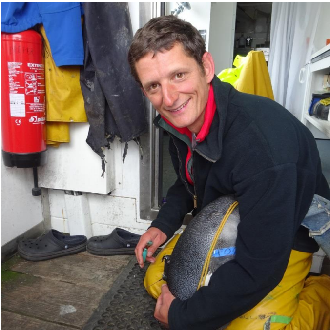
Figure 2. Retrait de la balise Argos 166437 de F04, le 25 février 2018. On équipe les oiseaux d'une cagoule pour les manipuler, car ils se calment lorsqu'ils sont dans l'obscurité !

- F04 (le conjoint de F14) qui quant à lui portait la balise 166437 , est revenu le 24 février, après 15 jours en mer. J'en ai profité pour retirer sa balise (figure 2), et la reposer le lendemain sur l'individu V00, lequel est parti en mer le 26 février (pas facile à suivre tous ces mouvements !)