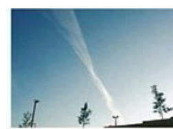
Persistantes non étalées Persistantes étalées