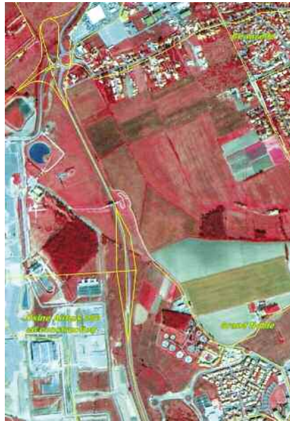
Image Spot 5 de 2002 (2,5 m de résolution). 2002 SPOT 5 image (2.5-m resolution).