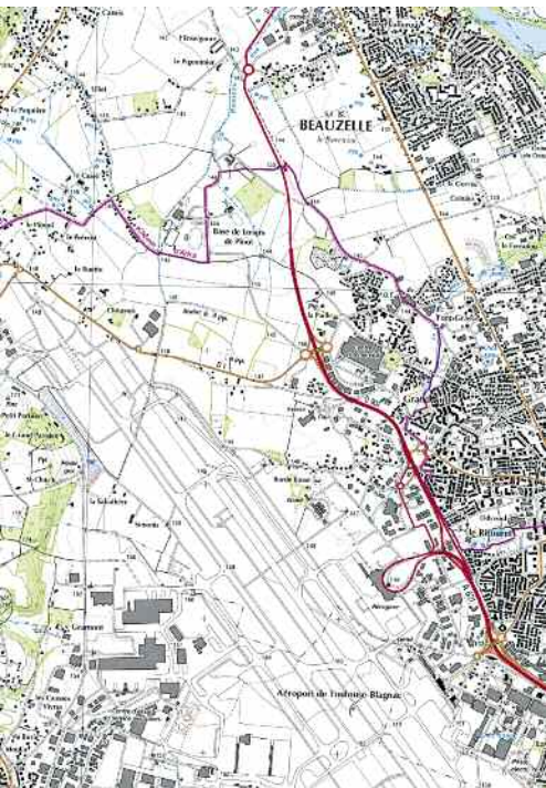
Extrait carte IGN 1/25000. Extract from IGN 1:25 000 map.

L'étude IGN a porté sur l'analyse de l'impact de la ligne de tramway Toulouse-Blagnac avec son extension jusqu'au nouveau terminus nord et à la gare de triage dans la zone aéroportuaire nord de Toulouse-Blagnac.